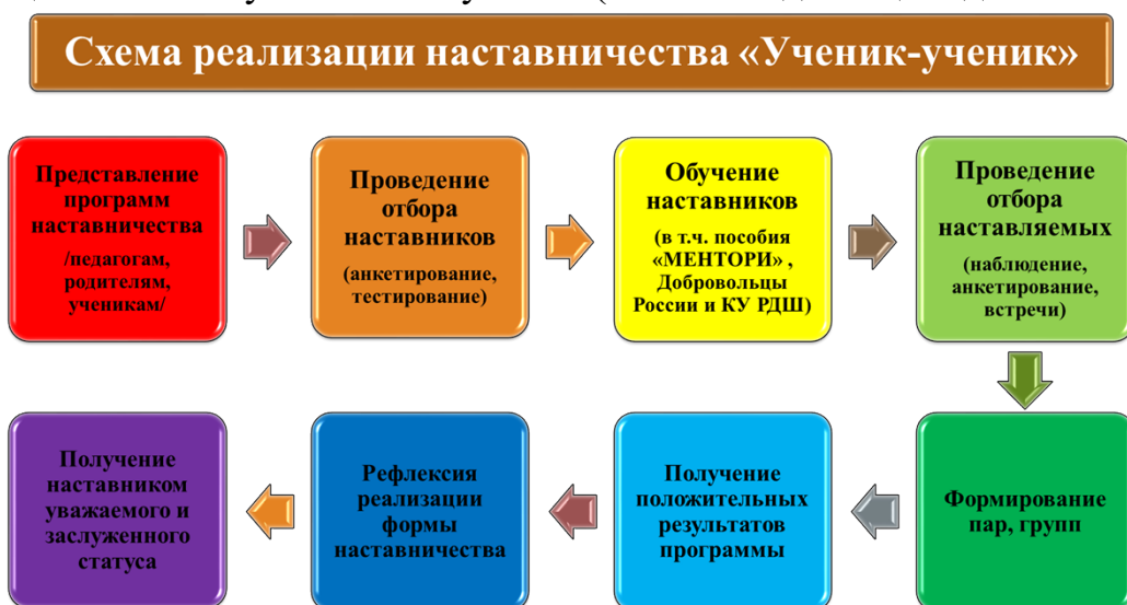
Рис.1. Описание схемы реализации наставничества «ученик-ученик»

Целью взаимодействия наставника и наставляемого является разносторонняя поддержка обучающегося с особыми образовательными/социальными потребностями либо временная помощь в адаптации к новым условиям обучения (включая адаптацию детей с ОВЗ).